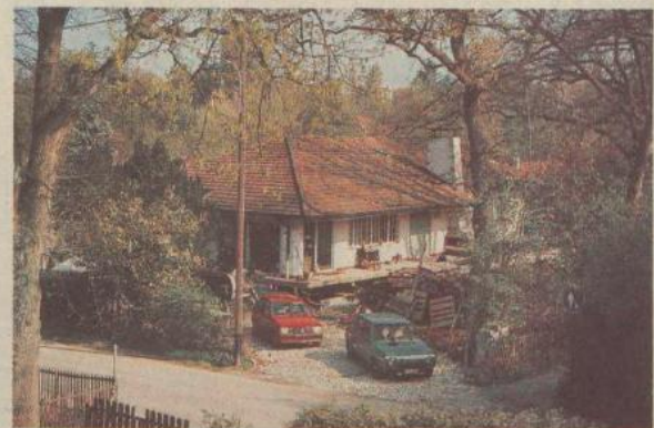
La maison de 240 tonnes a été soulevée à l'aide de vérins hydrauliques. La hauteur de 75 cm atteinte, la maison a été posée sur des rails et déplacée par le principe des galets.

Plus précisément, moins de douze heures de travail effectif ont suffi avant